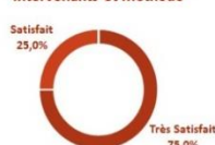
Intervenants et Méthode

■ Très Satisfait ■ Satisfait ■ Moyennement Satisfait ■ Peu Satisfait ■ Pas Satisfait